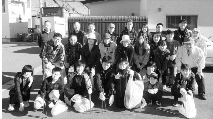
参加された皆さん、お疲れ様でした！

10/21(日)午前9時より神山町会主催の町内清掃が行われました。当日は気持ちの良い快晴での清掃日和となりました。町内清掃には当販売所も毎回参加させて頂いております。日頃からの環境美化に対する意識を高め「住みよい町づくり」を目指していきたいですね。