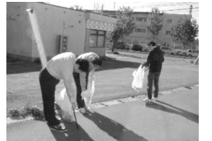
当販売所も参加しました