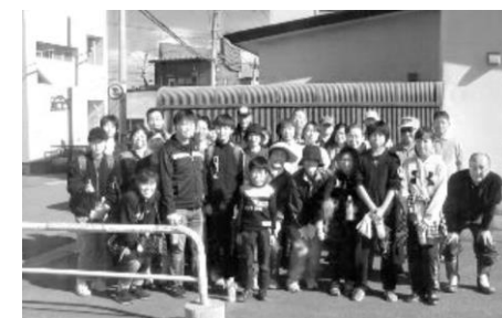
町内会の皆さん お疲れ様でした

10/14(土)神山町会主催の町内清掃が行われました。当日は気持ちの良い快晴での清掃日和となり、地域の皆様が170名も参加されました。当販売所も町内清掃には毎回参加させて頂いております。日頃からの環境美化に対する意識を高め「住みよい町づくり」を目指していきたいですね。